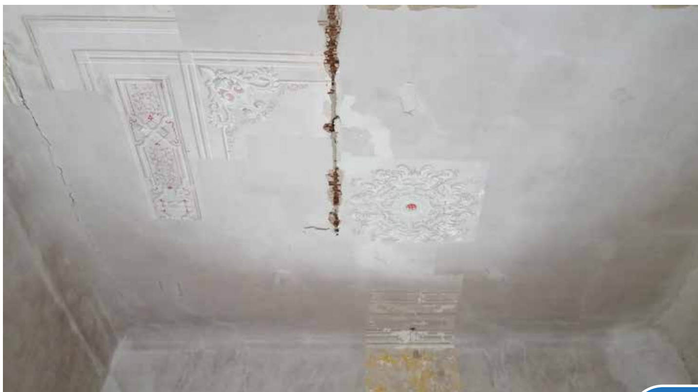
Odhalená maliarska ornamentálna výzdoba na strope príľhlej miestnosti pri zámockej kaplnke

odd. regionálneho rozvoja a dotačnej politiky