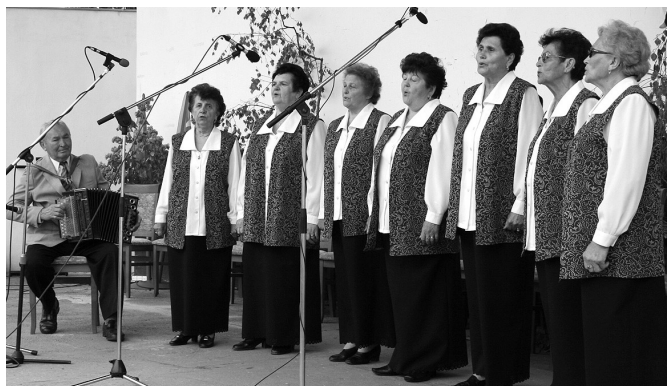
Takto sa predstavila Luna aj v Piešťanoch.

Naše dievčatá mali veľký úspech najmä s piesňou „Tak jak teče do Dunaja Morava“, pri ktorej nastalo v sále doslova hrobové ticho. Môžeme povedať, že veľmi úspešne reprezentovali svoj kraj i mesto Holíč, ako i všetky ostatné zúčastnené zbory. Podujatie malo veľmi vysokú úroveň.