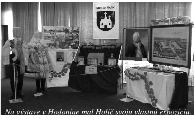
Na výstave v Hodoníne mal Holíč svoju vlastnú expozíciu.

„Nedaleko Hodonína...co je to tam za dedina...“ sa spieva v známej piesni zo Slovácka. Obce Čejč, Čejkovice, Dolní Bojanovice, Josefov, Lužice, Mikulčice, Nový Poddvorov, Prušánky, Ratíškovice, Rohatec, Starý Poddvorov, Terezín, Hodonín ale i mesto Holíč sa zúčastnili prezentačnej výstavy s rovnomenným názvom, ktorá sa konala od 4. do 12. októbra v dome kultúry v Hodoníne v rámci projektu Cisárskych hodov.