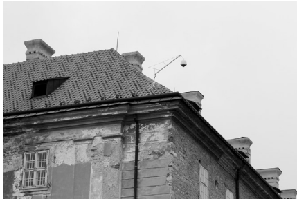
Jedna z dvojice nových kamier nainštalovaných na objekte zámku.

Zavedenie kamerového systému pred vyše rokom sa Mesto rozhodlo zrealizovať s cieľom znížovania výskytu negatívnych javov či kriminality