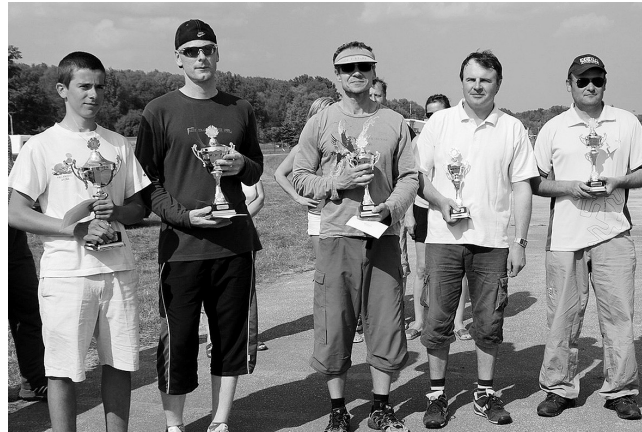
Päť najúspešnejších pretekárov.

Prvý májový víkend sa letisko Aeroklubu Holíč stalo dejiskom ďalšieho ročníka medzinárodnej leteckomodelárskej súťaže rádiom ovládaných modelov kategórie F3J. Tohtoročný World Cup, Eurotour a Holíč City Cup 2009 privítal 63 súťažiacich zo Slovenska, Českej republiky, Nemecka, Maďarska, Poľska, Talianska, Rakúska a Slovinska.