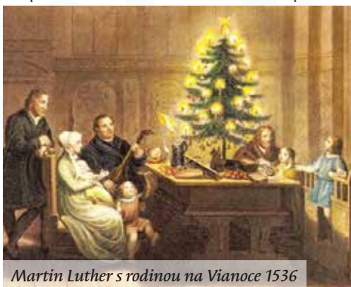
Martin Luther s rodinou na Vianoce 1536

na ohni, dnes už tradičná kapustnica sa však v tomto období neobjavovala vôbec. Spomedzi koláčov boli už v minulosti obľúbené anízové koláčiky, perníky a vianočky. Vo veľkom sa pilo pre toto obdobie tradičné víno a pivo.