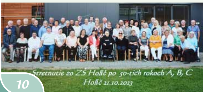
Stretnutie zo ZŠ Holíč po 50-tich rokoch A, B, C Holíč 21.10.2023