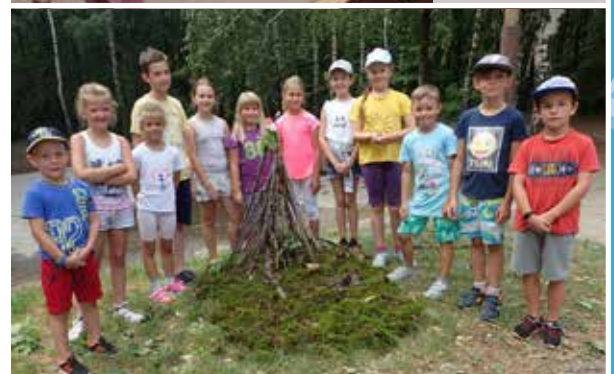
tábor Cestou necestou