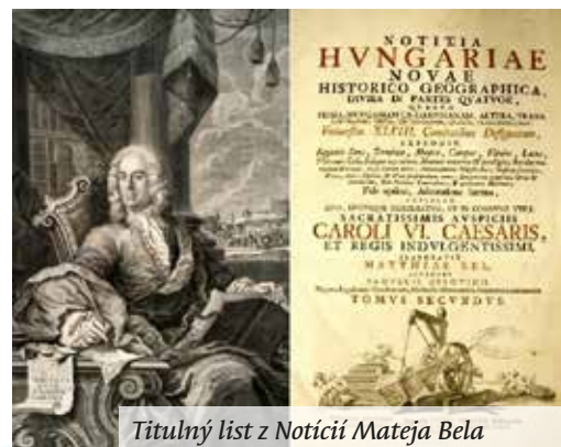
Titulný list z Notícií Mateja Bela

Holíč je mestečko vybudované blízko u Moravy na rovinatom kraji. Či sa mylím? Je došť možné, že vďaka rovnej, holej krajine prijal aj svoje meno. Keďže Holy znamená v slovanskom jazyku lysý. Holíč je teda rovina. Ale o meno to tu teraz nejde. Kedysi bol v moci pána Stibora, čo dokazujú záko-