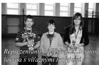
Reprezentanti holíčskej ZŠ Bernolákova s víťaznými trofejami