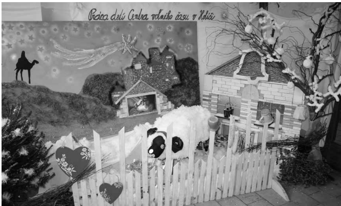
K spríjemneniu predvianočnej atmosféry prispelo aj holíčske Centrum voľného času. Šikovné ruky i vlastná fantázia dokázali premeniť časť vestibulu budovy fajansy na príjemné miestečko ponorené do snehobielej atmosféry blížiacich sa Vianoc. Verme, že túto krásnu neporušenú podobu si uchová po celý čas pre potešenie oka i duše...

Chýbať nebude ani tradičný primátorský punč, ktorý budú môcť záujemcovia ochutnať počas prvých dvoch dní Holíčskych vianočných dní v piatok a sobotu 17. a 18. decembra. Tie slávnostne otvorí 17. decembra popoludní primátor Zden-