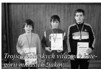
Trojica holíčskych víťazov v kategórii mladších žiakov.